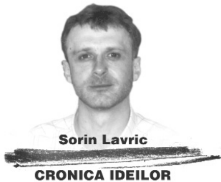
Sorin Lavric CRONICA IDEILOR

arta lui Bernstein are meritul de a nu se număra printre pietrele encomiastice puse din inerție la temelia soclului lui Einstein. Am fi avut atunci încă una din multele cărți plate care au dus la demonetizarea numelui lui.