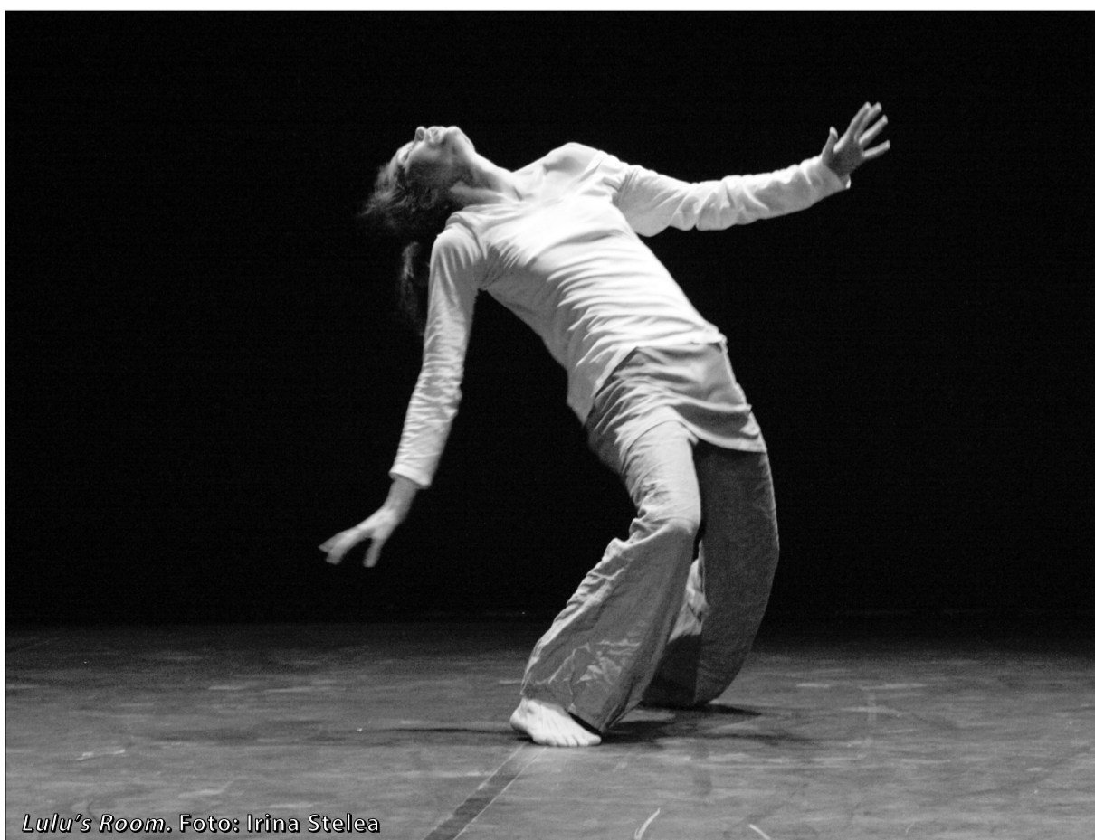
Lulu's Room.

Platforma Dansului Contemporan din acest an a fost un adevărat maraton, care a scos în evidență configurația mișcării actuale a acestui gen, din țara noastră, gen deosebit de dinamic, dar rămas dator, în mare măsură, propriei lui arte, arta mișcării ca mijloc de expresie artistică.