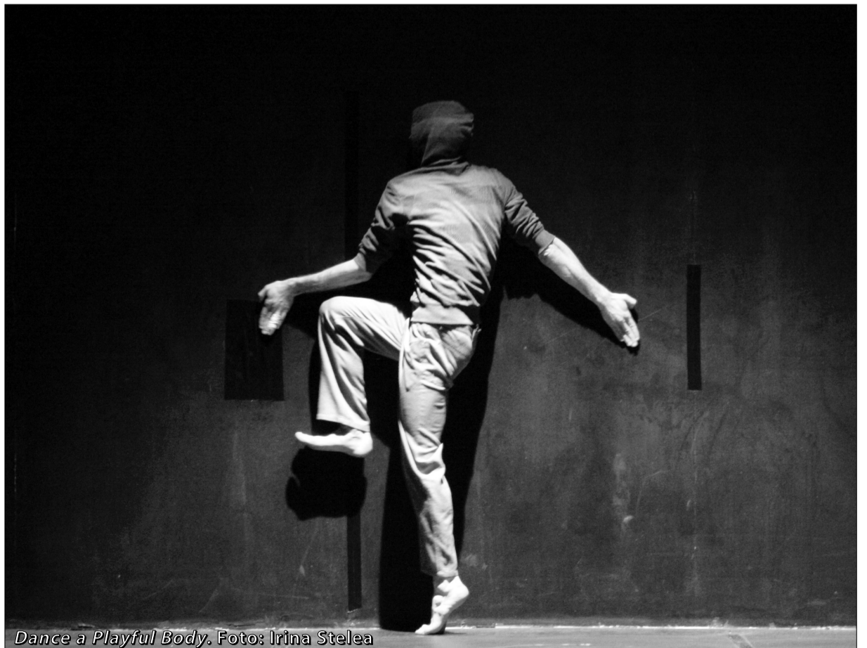
Dance a Playful Body.