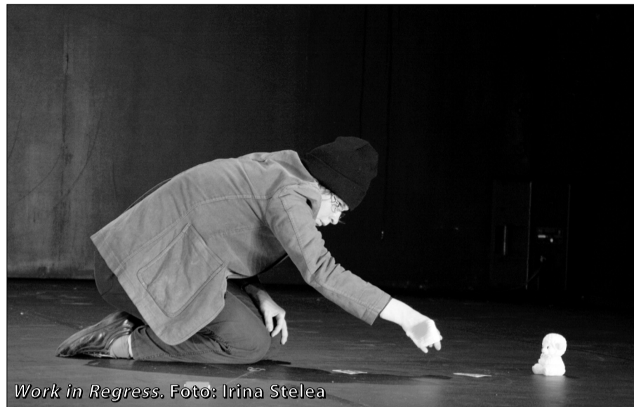
Work in Regress.