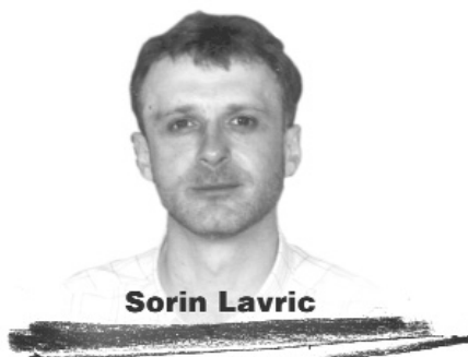
Sorin Lavric CRONICA IDEILOR

să fie atît de reticent în cultivarea lui? Pur și simplu, superstiția pe care tradiția filozofică a întreținut-o în privința acestui concept: potrivit opticii ei milenare, adevărul e scopul cunoașterii. El e precum capătul unui drum a cărui străbateră echivalează cu cunoașterea, iar cel care a apucat să afle adevărul nu se mai poate purta în viață decît conform lui. Și astfel, atitudinea omului, dictată fiind de lumina adevărului, va fi una morală. De aici reiese că imoralitatea înseamnă neștiință