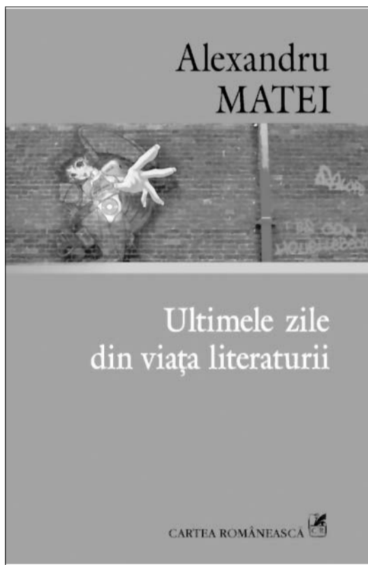
Alexandru Matei, Ultimele zile din viața literaturii , Editura Cartea Românească, 2008, 392 pag.

informative celor care, dintr-o perspectivă strict ideologică – pentru că în acești termeni e ridicată, aici, problema – se apropie de stânga? Am, ca perfect outsider , dubii. Ceea ce condamnă Alexandru Matei, schimbând, abil, macazul din mers, ține de inteligența polemică politică, nicidecum de agenda bibliografică a aceleia ideatice.